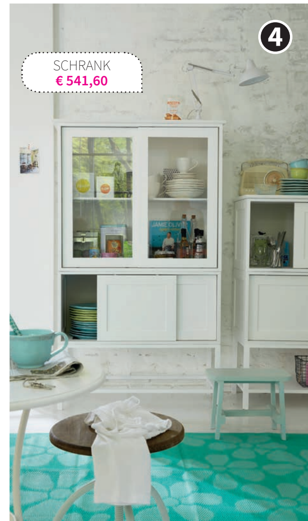
SCHRANK € 541,60