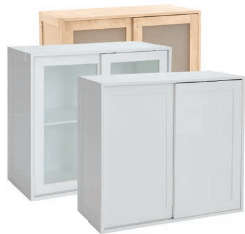
Schiebetür 86 Inklusive einem Einlegeboden Maße (HxTxB): 86 x 44 x 96 cm

Wohnmodule alle Module dieser Serie sind aus Erlenholz in unbehandelt, gewachst und weiß lackiert gefertigt und werden fertig montiert ohne Griffe versendet. Die flexiblen Möbel müssen lediglich miteinander verschraubt werden, lassen sich nach Ihren individuellen Wünschen zusammenstellen und eignen sich perfekt für Küche, Schlaf- und Arbeitszimmer.