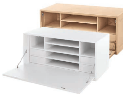
Sekretär mit Klappe 43

Maße (HxTxB): 43 x 44 x 96 cm Modell unbehandelt: HOKOX4X1E € 159,90 Modell gewachst: HOKOG4X1E € 179,90 Modell weiß: HOKOW4X1E € 179,90