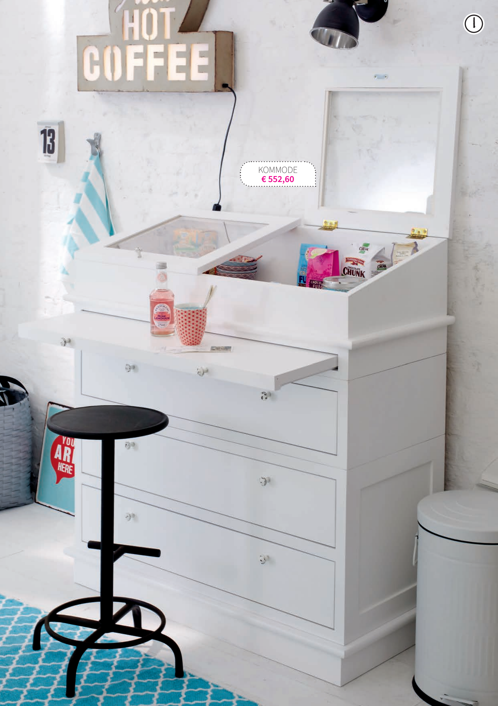
KOMMODE € 552,60